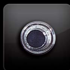
mechanický kombinační zámek