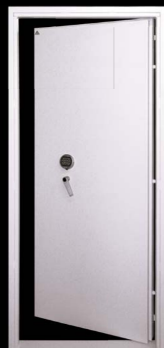
Trezorové dveře s otvíráním do chráněného prostoru