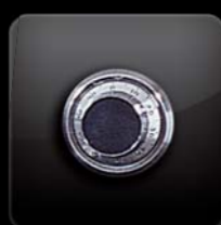
mechanický kombinační zámek