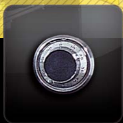
mechanický kombinační zámek